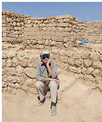
Рис. 16. На ступенях, ведущих к храму Старого города Сумхурам. Оман. Ноябрь 2016 г. Из фотоархива Ю.А. Виноградова 44