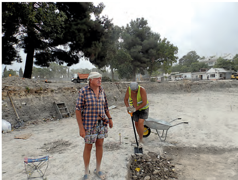
Рис. 19. Ю.А. Виноградов на раскопе в Херсонесе. Крым, Севастополь. Июль 2021 г.

<...> Я по-прежнему тружусь в Севастополе, ведем масштабные раскопки к югу от оборонительной стены Херсонеса. Пока в одном из углов раскопа, расположенного недалеко от стены, нашли несколько античных грунтовых могил, а также «аллею» склепов (некоторые из них уже были раскопаны, но один — абсолютно цельный, был закрыт каменной плитой).