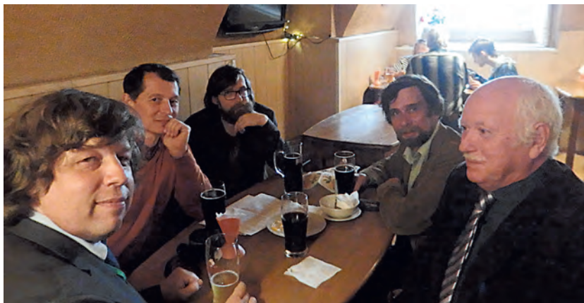
Рис. 10. Посиделки в кабачке «Бочка» на Миллионной после конференции в Эрмитаже «Крым — перекресток цивилизаций: история, литература и взаимовлияние культур крымских народов» (СПбГУ / Государственный Эрмитаж).

в насыпях боспорских курганов» (с. 124–129) 34 . Он является одним из авторов фундаментального издания «Отцы-основатели РАИМК: их жизненный путь и вклад в науку».