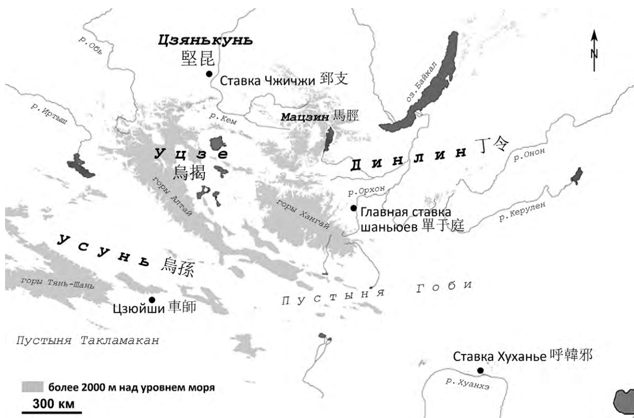
Рис. 2. Локализация Цзянькунь и ряда соседних владений, а также ставок правителей хунну в поздний период Западной Хань

Подводя итоги, можно сделать вывод, что хозяином Абаканского дворца являлся Чжичжи шаньюй. Он единственный вероятный обладатель титула Сын Неба, о котором есть прямые сведения, что в 40-е гг. до н.э. он создал резиденцию на северо-западной окраине империи хунну в землях Цзянькунь (кыргызов). Географическая локализация Цзянькунь лучше всего соответствует Минусинской котловине – основной территории, которую государство Кыргыз занимало и в последующие века вплоть до начала XVIII в. Появление титула Сын Неба на черепице Абаканского дворца находит соответствие в вывешивании знамен Сына Неба на стенах резиденции Чжичжи в землях Канцзюй в 30-е гг. до н.э. Наряду с использованием приемов престижной дворцовой архитектуры Хань для Чжичжи это было способом продемонстрировать и символически утвердить свой высокий статус верховного правителя.