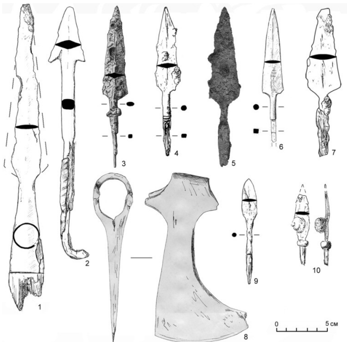
Рис. 3. Курганные могильники Которск III, Которск IX и Которск XI. Предметы вооружения. 1, 2, 4–7, 9 — Которск XI; 3, 8 — Которск IX; 10 — Которск III. 1–7, 9 — железо, дерево; 6, 10 — железо

среди исследованных в Которске захоронений, так и в целом в погребениях региона, традиции помещения в могилу бытовых предметов позволяет поставить под сомнение узкоутилитарное — охотничье — назначение наконечников этого типа. Наконечник отличается от описанного выше, происходящего из нижних напластований селища: у более раннего экземпляра шипы имеют более крутой угол перегиба. Черешковые двушипные ангонообразные копья в древнерусских материалах редки, территориально ближайшая находка двушипного втульчатого наконечника копья происходит из раскопанного Н. Н. Чернягиным кургана у дер. Адамово в Восточном Причудье (Чернягин 1940: 26).