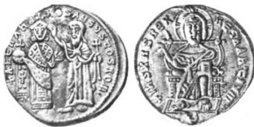
Рис. 2. Гнёздовское городище. Подвеска-номисма 912–913 гг. (по: Тиханова 1945: 29, рис. 22)

киевских кладах представлено дирхемами (Комар 2012: 320), но состав дирхемов уже отражает перемену в распределении серебра на рубеже IX и X вв. В течение предыдущего девятого столетия арабское серебро (аббасидские дирхемы) поступали на Русь и в Скандинавию через Кавказ и Хазарию; в последней четверти этого столетия приток монеты прекращается, что может быть связано с вторжением Олега в сферу влияния Хазарии в Приднепровье и хазарской блокадой, которую при Олеге