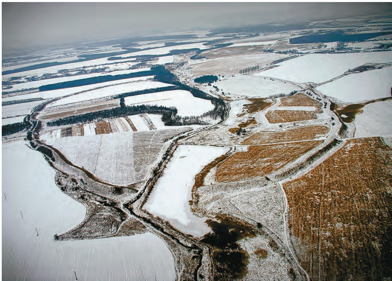
Рис. 7. Немировское городище, аэрофотосъемка. (по Дараган 2010а: рис. 25, 1; 2012; Kaschuba, Vakhtina 2012: Abb. 2, 2)

пок этого важнейшего и в буквальном смысле слова ключевого памятника, хотя отдельные вещи и категории находок постоянно привлекают внимание исследователей.