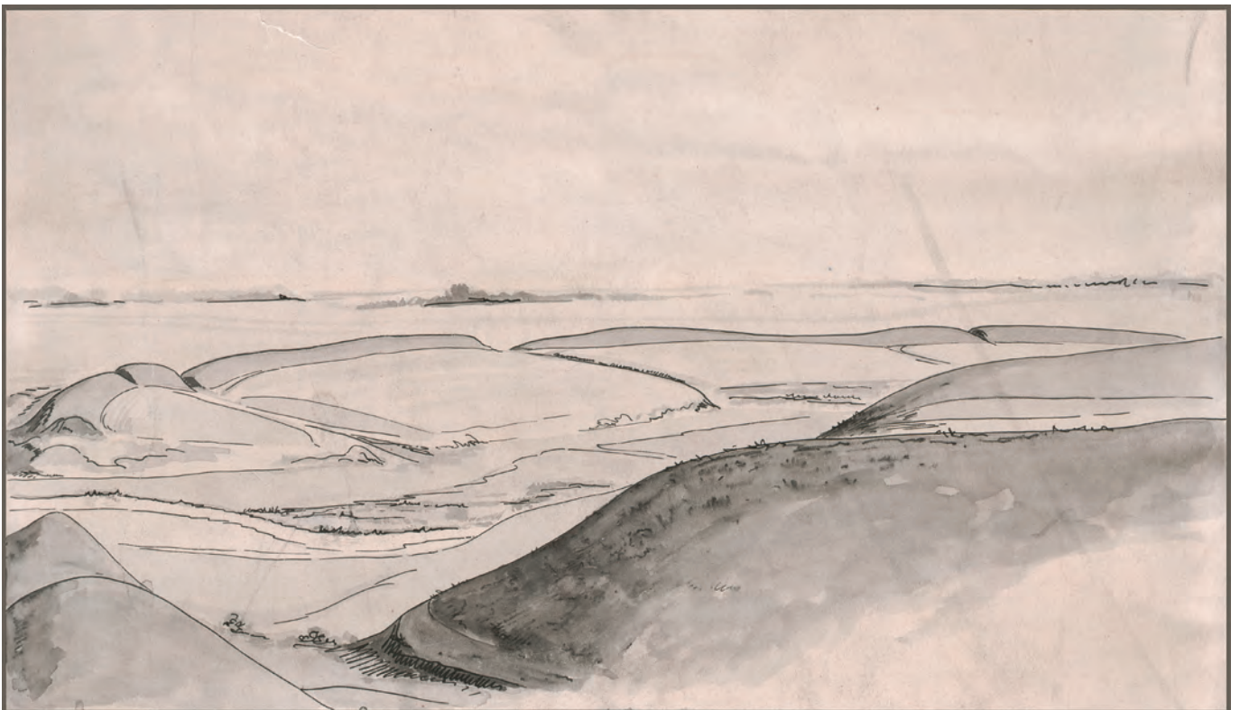
Рис. 6. Немировское городище, вид с юга (графический лист, М. И. Артамонов, 1947 г.; НА ОАВЕС ГЭ)

До сих пор не существует полной публикации материалов, происходящих из раско-