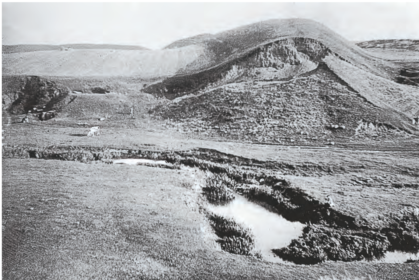
Рис. 3. Немировское городище, Большие валы, фотография 1948 г. (НА ИИМК РАН: II 49770; публикуется впервые)