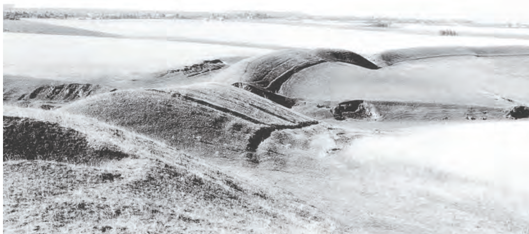
Рис. 1. Немировское городище, Большие валы, восточная часть, фотография 1946–1947 гг.

Наибольшее значение поселение приобрело в раннем железном веке. Судя по имеющимся в нашем распоряжении материалам, расцвет поселения этой эпохи