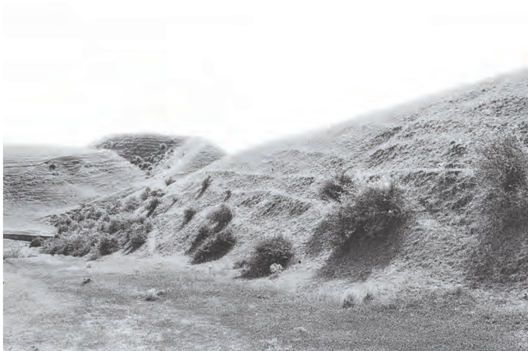
Рис. 2. Немировское городище, Большие валы, юго-западная часть, фотография 1946–1947 гг. (М. И. Артамонов, НА ОАВЕС ГЭ)